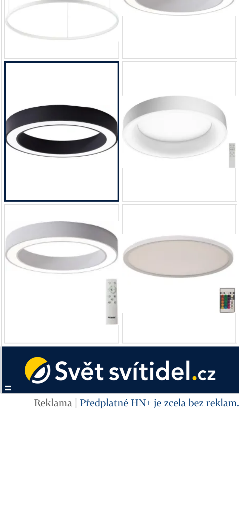
Reklama | Předplatné HN+ je zcela bez reklam.

ADVERTISING | Předplatné HN+ je zcela bez reklam.