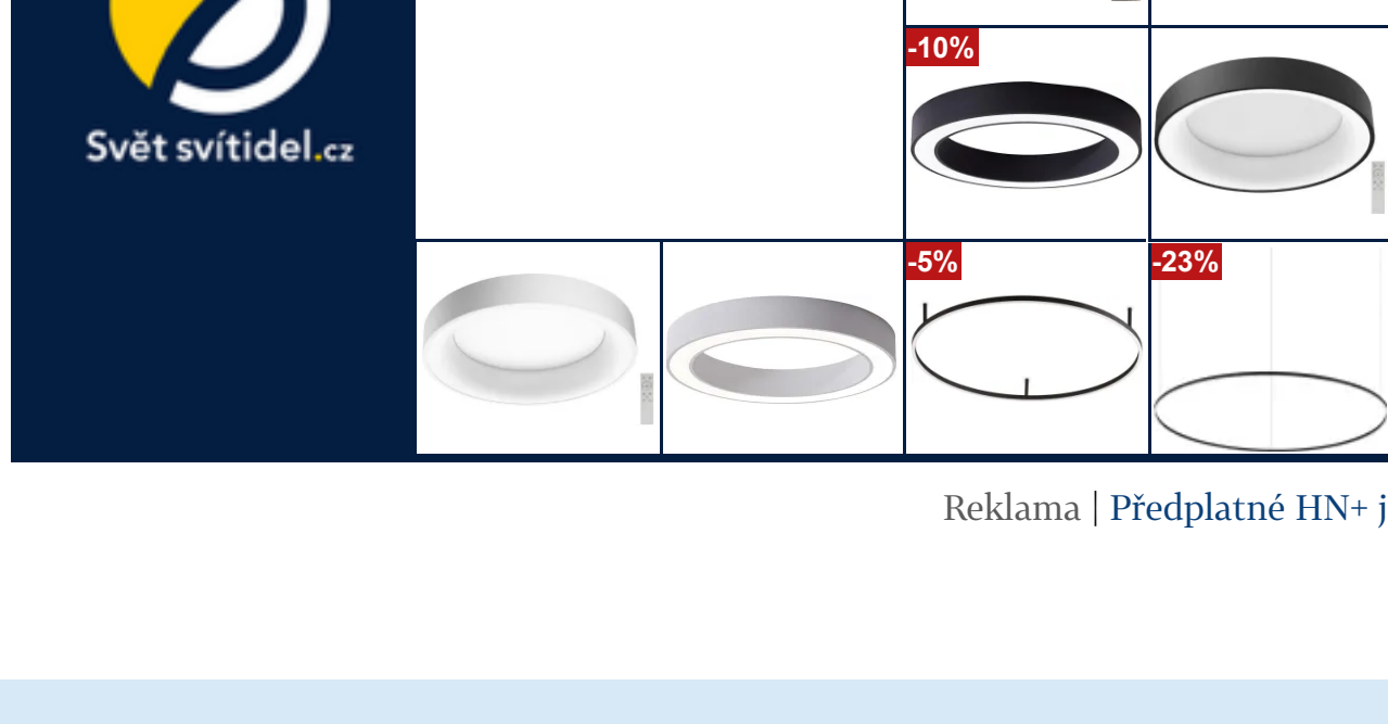
Reklama | Předplatné HN+ je zcela bez reklam.